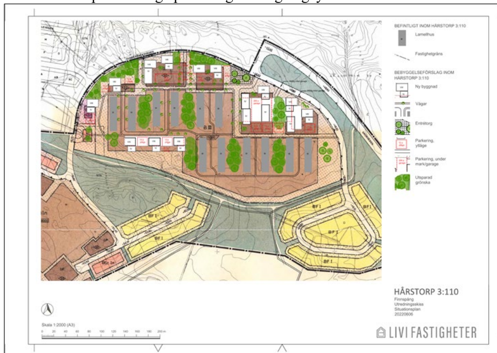
Figur 1: Bilden visar Livi fastigheters förslag till utformning av fastigheten Hårstorp 3:110

Livi fastigheter har inkommit med en begäran om detaljplaneläggning för Hårstorp 3:110 (del av D142) från 1972. I ansökan önskar de utveckla området med förtätningar och ökade bostadsmöjligheter. Dessa förtätningar önskas i huvudsak ske på befintliga parkerings- och garageytor.